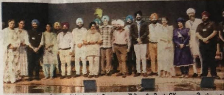
'ਯੰਗ ਪ੍ਰੋਗਰੈਸਿਵ ਸਿੱਖ ਫੋਰਮ' ਦੇ ਗਠਨ ਮੌਕੇ ਪਹੁੰਚੀਆਂ ਸਿੱਖ ਹਸਤੀਆਂ।