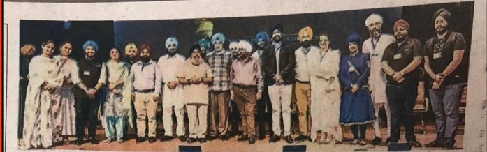
ਸਮਾਗਮ ਦੌਰਾਨ 'ਯੰਗ ਪ੍ਰੋਗਰੈਸਿਵ ਸਿੱਖ ਫੋਰਮ' ਦੀ ਸ਼ੁਰੂਆਤ ਕਰਦੇ ਸ਼ਖਸੀਅਤਾਂ।